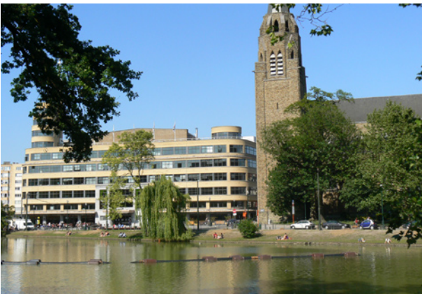
Zicht op Flagey en de Heilige-Kruiskerk

De wandeling begint en eindigt bij de tramhalte 'Flagey'. Reken op anderhalf uur stappen.