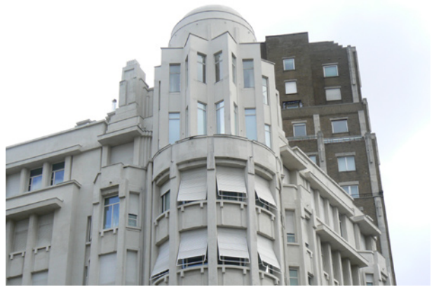
Palais de la Folle Chanson