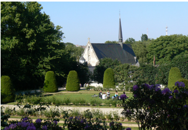
Zicht op de Terkamerenabdij