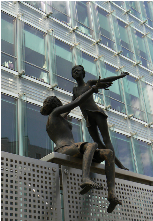
Karel de Grote gebouw