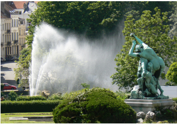
Het dwaze lied