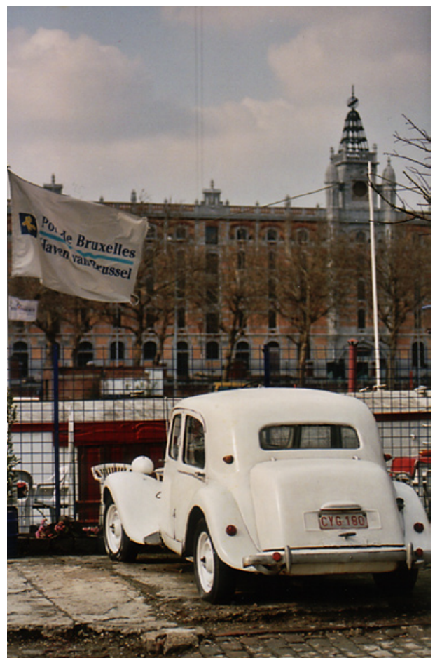
Haven, Ric's Art Boat

In het gele art decogebouw links voorbij de brug zetelt het havenbestuur. Ga voorbij het havengebouw om de hoek. Het grote omheinde gebied aan de overkant van de Havenlaan is de site van 'Thurn & Taxis' (9) . Ooit lagen hier zompige weiden nabij de Zenne waar de adellijke familie Thurn & Taxis, die postlijnen exploiteerde, paarden liet grazen die ingezet werden als trekdier voor de postkoetsen. In het begin van de 20ste eeuw kwamen er reusachtige stapelhuizen met aansluitende spoorrangeerinfrastructuur bij de nieuwe zeehaven. In het verlengde van het zebrapad heb je zicht op een magazijn met zaagtandstructuur ('sheddak'). Dit dak overspant een breedte van 60 meter zonder steunpunten en bevat