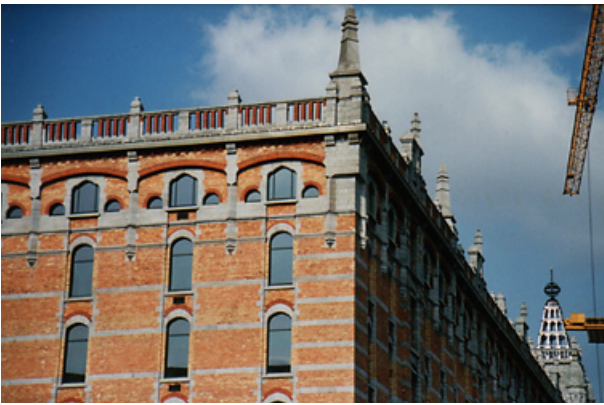
Thurn & Taxis